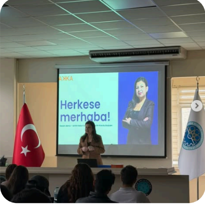
ULUDAĞ ÜNİVERSİTESİ TEKSTİL MÜHENDİSLİĞİ