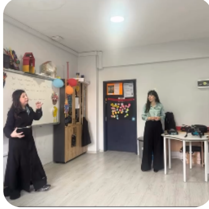
INTERNATIONAL BACCALAUREATE WORLD SCHOOL