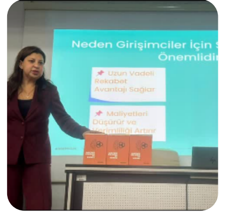
ULUDAĞ ÜNİVERSİTESİ UMAKİT TOPLULUĞU