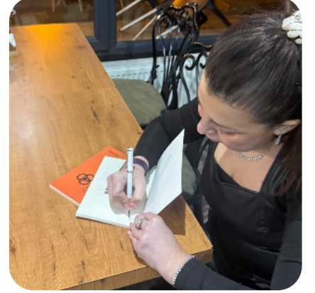
BÜKAD NOKTALAMA KOMİTESİ