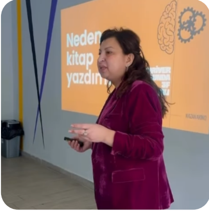
INTERNATIONAL BACCALAUREATE WORLD SCHOOL